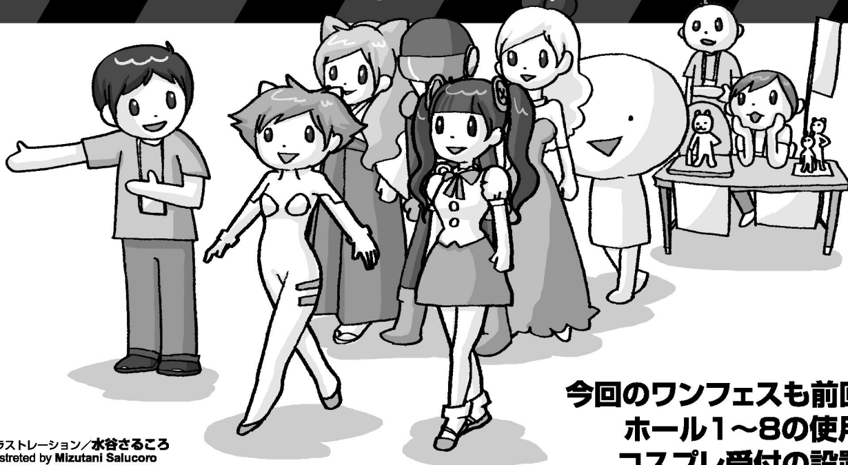
イラストレーション/水谷さるころ illustrated by Mizutani Salucoro

今回のワンフェスも前回同様に ホール1~8の使用なので、 コスプレ受付の設置場所も 前回と同様です