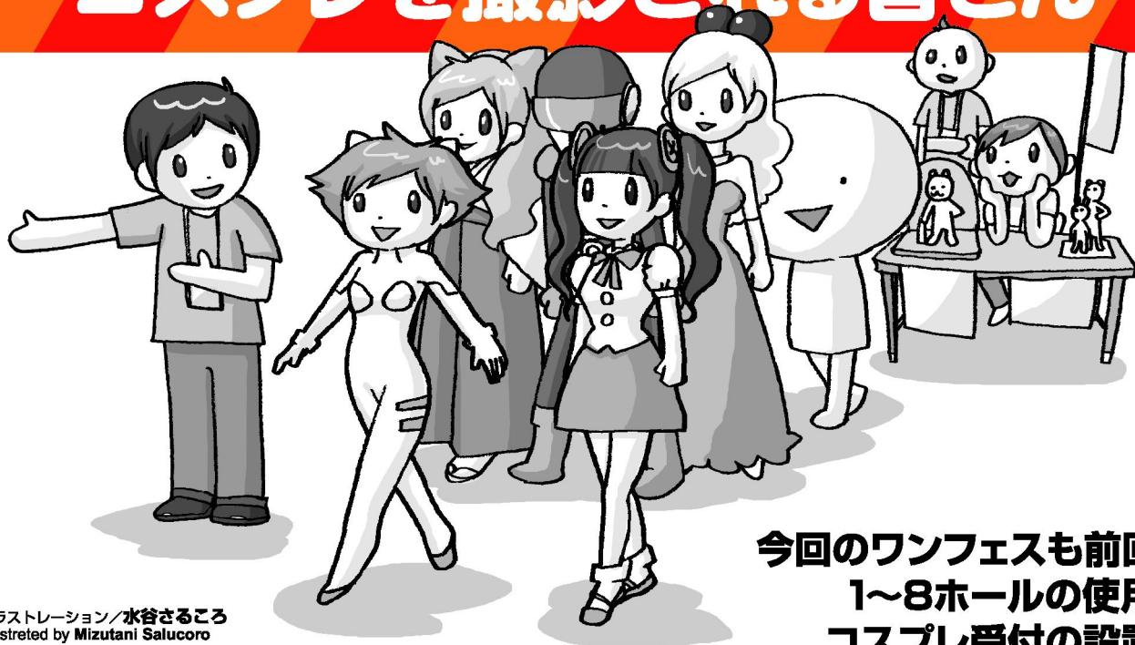
イラストレーション/水谷さるころ illustrated by Mizutani Salucoro

今回のワンフェスも前回同様に 1~8ホールの使用なので、 コスプレ受付の設置場所も 前回と同様です